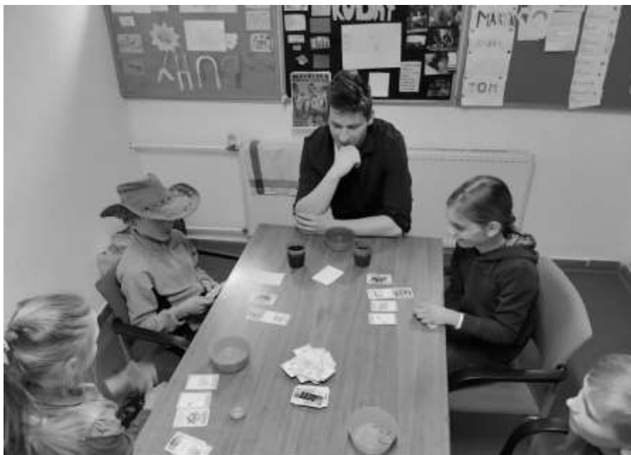
Hráči BANG při turnaji

První březnovou sobotu se uskutečnil turnaj v karetní hře BANG! V průběhu dopoledne změřili ostrost svojí mušky pistolníci z řad členů oddílu, někteří vybaveni westernovým oblečením. Ten nejlepší z nich si odnesl oddílový putovní pohár.