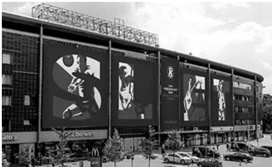
Fortuna aréna v pražském Edenu – místo konání všesokolských sletů