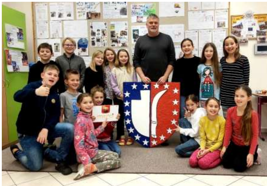
Žáci základní školy vyráběli znak obce