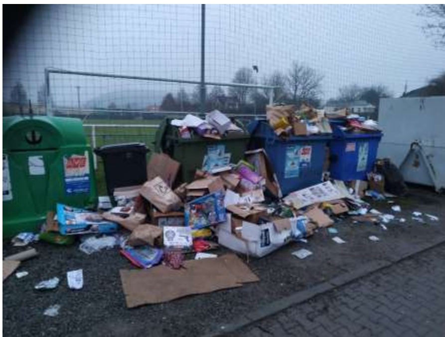
Takový nepořádek byl na Vánoce u sokolovny