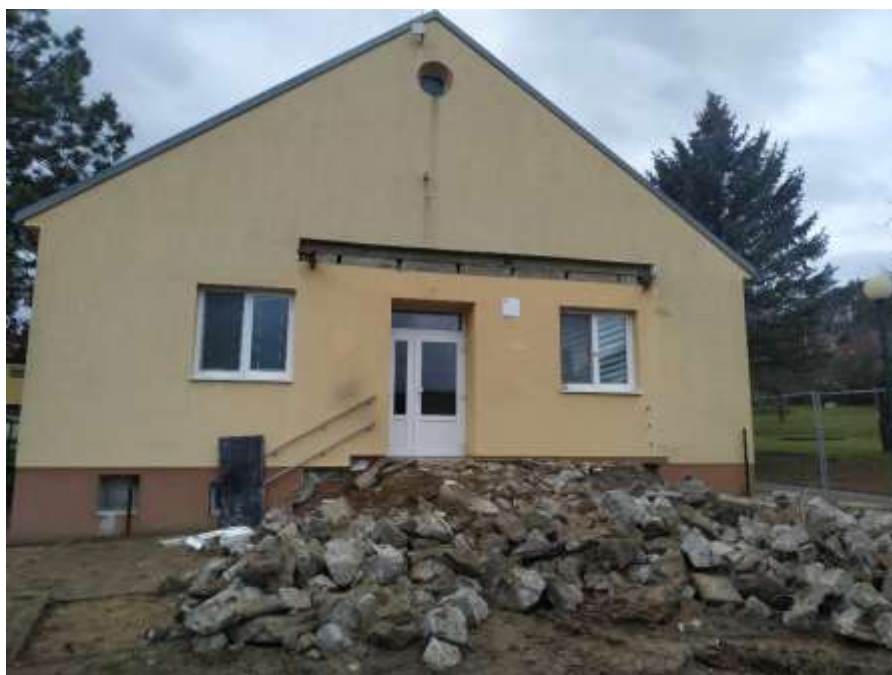
Školka bez vstupní terasy a bez schodů