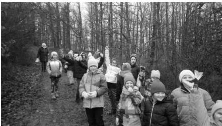
Žáci základní školy v lese