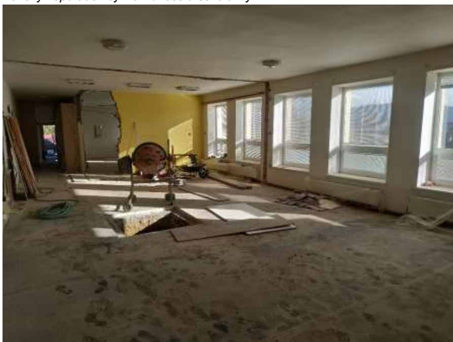
Bourací práce v mateřské škole