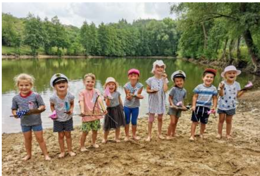
Prázdninový zahradní klub pro předškolní děti