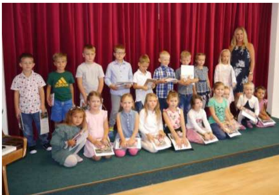
Prvňáčci – školní rok 2022-2023