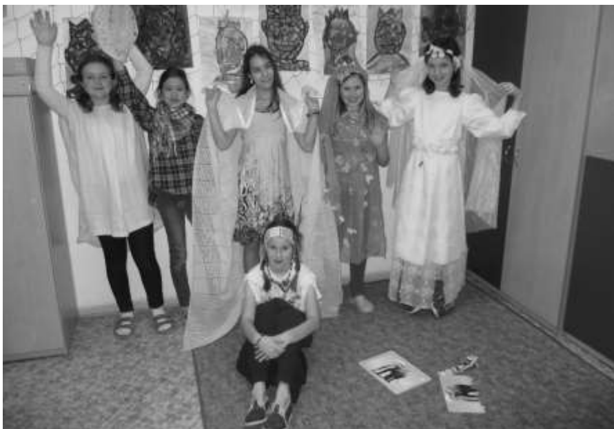
Zápis do první třídy r. 2014

Po zápisu uspořádá škola setkání s rodiči zapsaných dětí na seznámení se s prostředím školy, vzdělávacím programem a učitelkami.