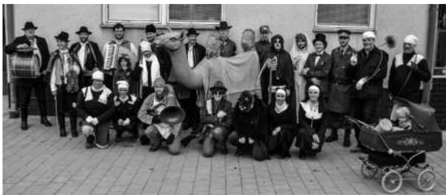
Masky na začátku občůzky u domu č. p. 85 „na konci“

Večer bývá tradičně zábava v sokolovně, ale o tom snad za rok :)