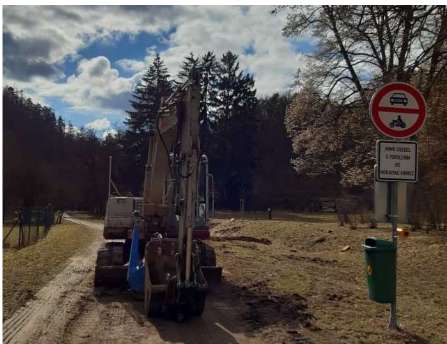
Zahájení bagrování cyklostezky v Mezihoří