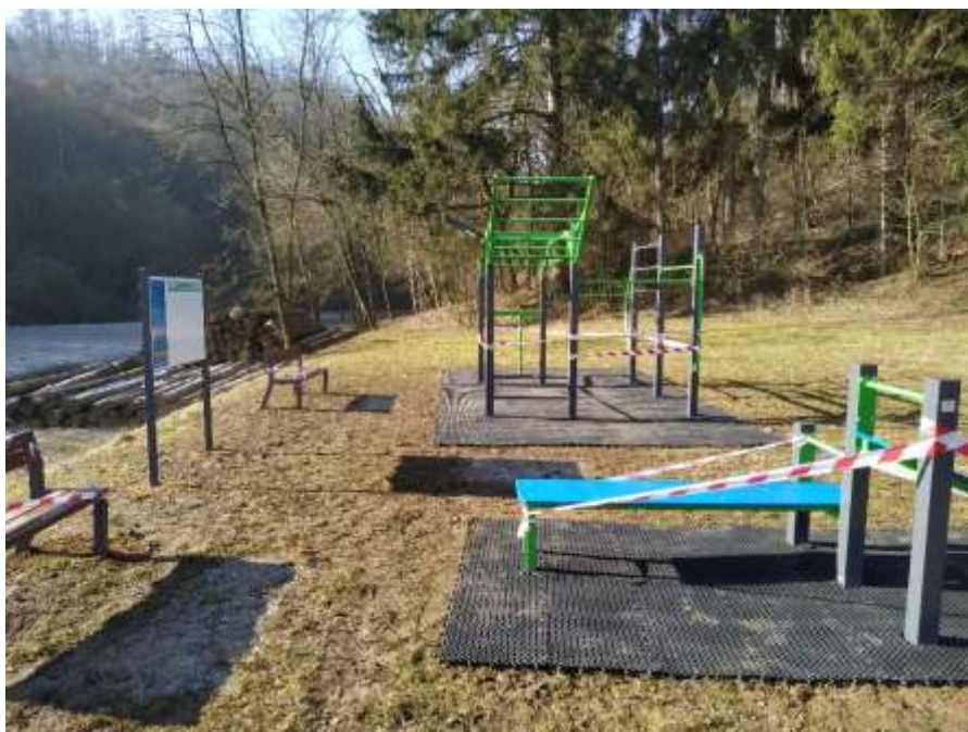
Workoutové hřiště v Mezihoří