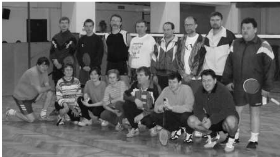
5. ročník velikonočního turnaje v badmintonu MIŇON cup 2004

čtyřher bylo přihlášeno 18 účastníků. Turnaje se účastnili hráči z Moravských Knínic, Kuřimi a Lipůvky.