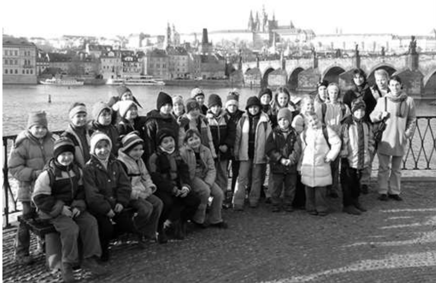
Žáci základní školy na výletě v Praze – prosinec 2004