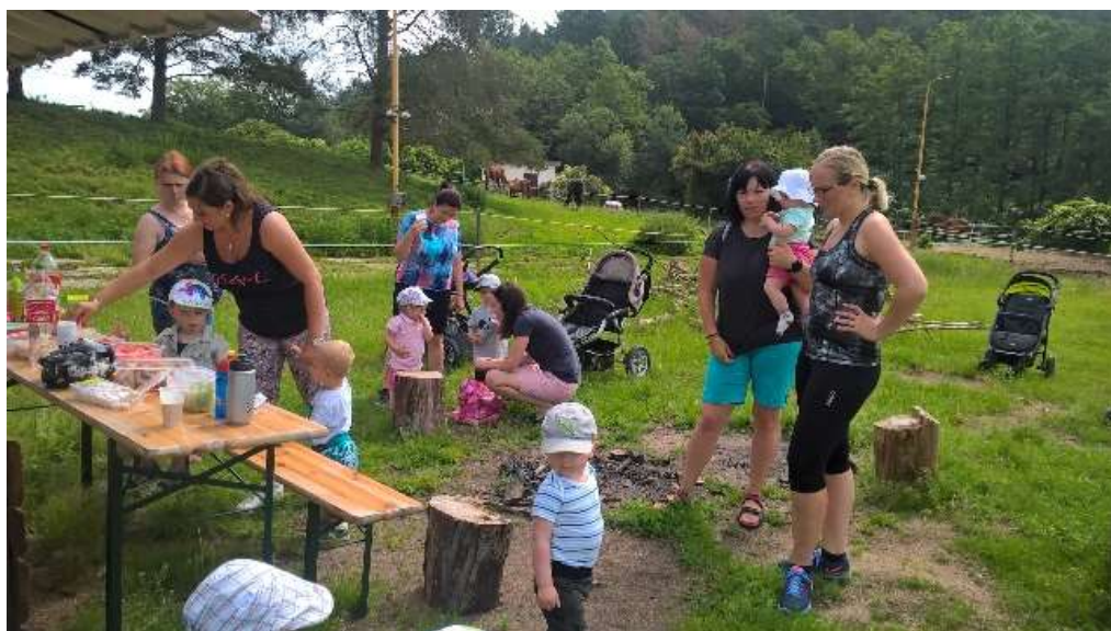
Rarášci na cestách