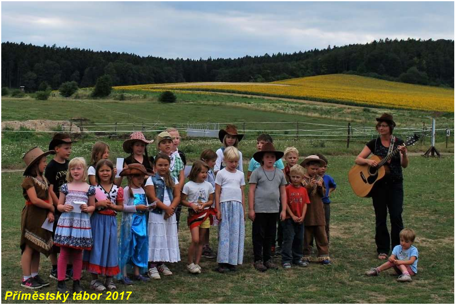
Příměstský tábor 2017