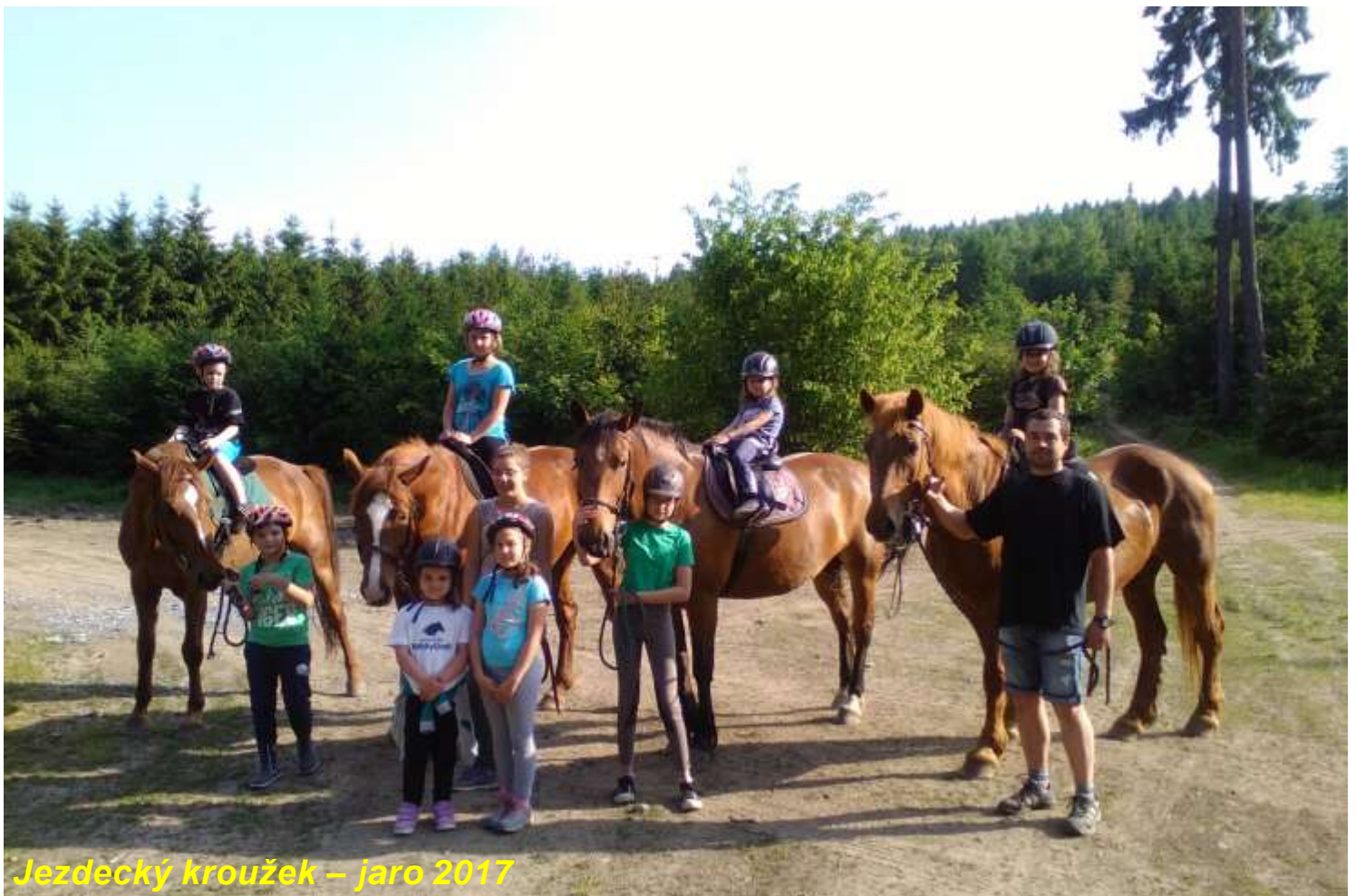
Jezdecký kroužek – jaro 2017