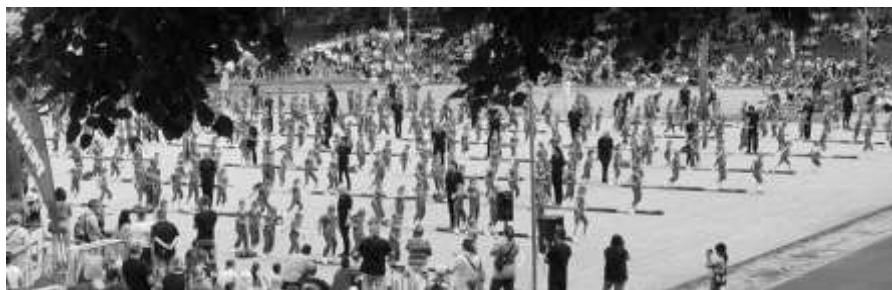
Mravenci na ploše stadionu