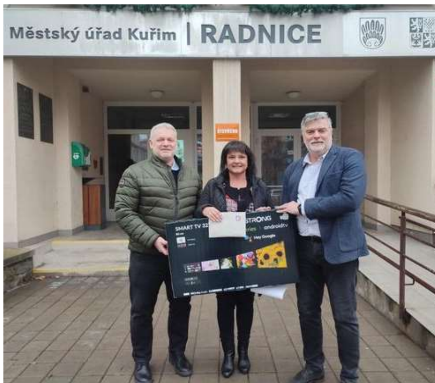
Předávání výtěžku sbírky před Městským úřadem v Kuřimi