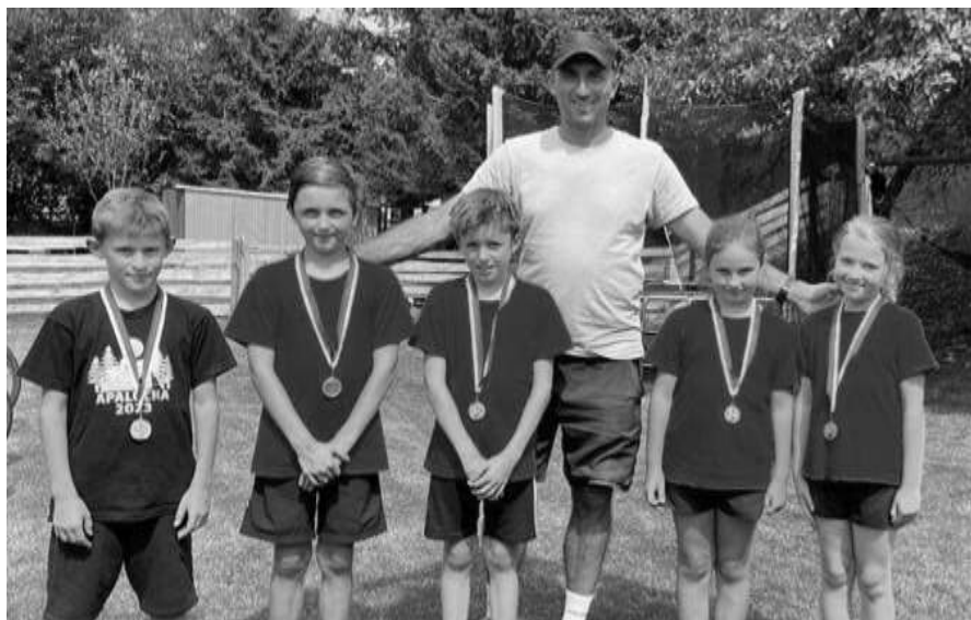
Účastníci tenisového kempu

V prázdninových týdnech 7.–11. 8. a 14.–18. 8. 2023 se na dvorcích u sokolovny konaly dětské tenisové příměstské kempy. Ty nakonec přilákaly desítku začínajících i závodních sportovců, kteří zdokonalovali svoji hru, hráli různé další hry, zvládli cyklovýlet, koupání i jízdu na koních. Touto cestou chci poděkovat TJ Sokol Moravské Knínice za pronájem kurtů i Vinotéce u Knoflíčků za obědové dobroty. Těším se na zájemce o tenis, nabírám nové zájemce všech kategorií od 5 let, předběžné termíny příměstských kempů jsou 12.–16. 8. a 19.–23. 8. 2024 (kontakt: jirihalama@gmail.com 607 760 559).