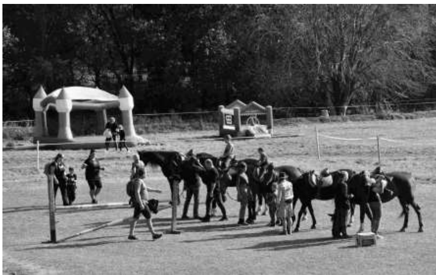
Projíždky na koňském hřbetě